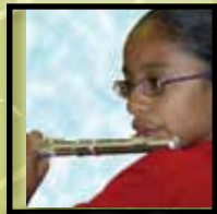
Artes Visuales y Escénicas