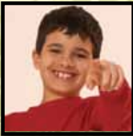
Programas de Idiomas

Distrito Escolar Unificado de la Ciudad de San Bernardi- no